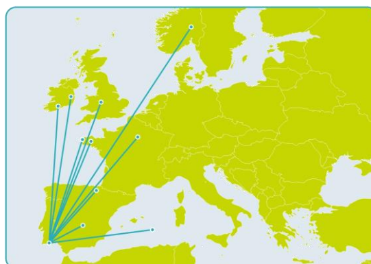
NETALGAE Inter-regional network to promote sustainable development in the marine algal industry