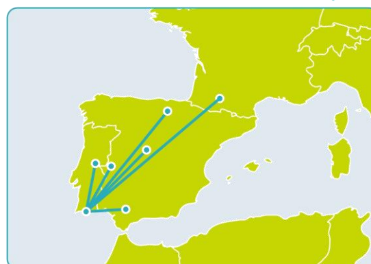
CREA-BUSINESS-IDEA Cluster Virtual de Criatividade Empresarial