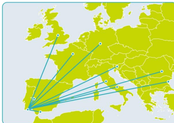
INOLINK Connecting the Territory Trough the Innovation Network