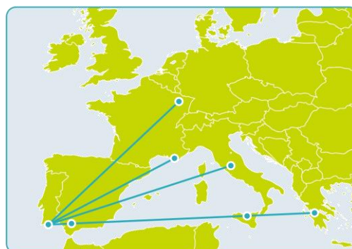
MED TECHNOPOLIS pour la mise en oeuvre d'un réseau méditerranéen de structures d'interface "technopolis"