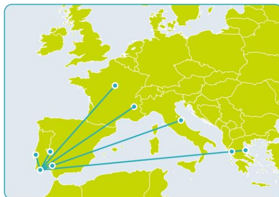
SMEs and Cooperative Economy for Local Development - ICS