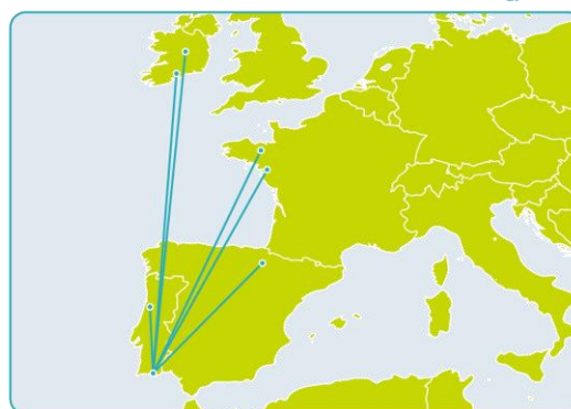
Share Biotech Sharing Life Science Infrastructures and Skills to Benefit the Atlantic Area Biotechnology Sector